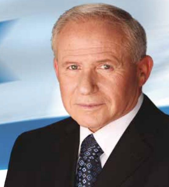
אבי דיכטר השר להגנת העורף

כעת, בשעה שהמזרח התיכון מתהפך לנגד עינינו, הליכוד צריך בטחוניסט חזק שמבין ערבית.